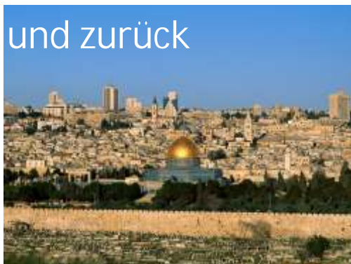
Blick auf Jerusalem und den Felsendom

Fahrt zur herodianischen Felsenfestung Massada. Weiterfahrt nach Qumran, dem Ort bedeutender Schriftrollenfunde.