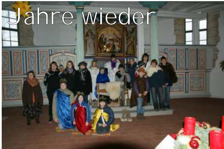
Krippenspielprobe in Ermstedt

Aber auch die Predigt ist alle Jahre wieder erfrischend wie auch warmherzig. 2011 hat